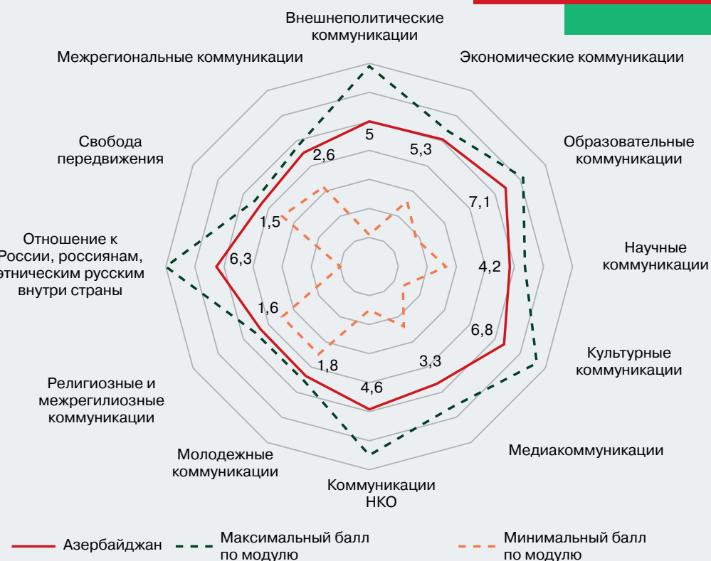
Рисунок 8 – Профиль коммуникационного режима Азербайджанской Республики (в баллах)

Коммуникационный режим Азербайджана в большей степени синхронизирован с Турцией, чем с Россией. При этом в стране созданы преимущественно благоприятные условия для развития коммуникаций с Россией. Наиболее показательны в этом отношении экономические связи двух стран и молодежные обмены. Наиболее динамичными и противоречивыми в 2023 г. были внешнеполитические коммуникации. Начал изменяться режим внешнеполитических коммуникаций Азербайджана, исходя из новой ситуации на Южном Кавказе. Коммуникации культурного, образовательного, информационного характера выстраиваются на основе четкого понимания Азербайджаном своего места и роли в цивилизационном стратегическом партнерстве с Турцией, странами региона и странами тюркского мира. Высока вероятность того, что именно этих сфер коснутся изменения в 2024 г.