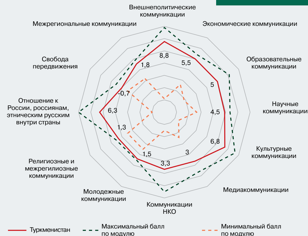
Рисунок 10 – Профиль коммуникационного режима Туркменистана (в баллах)

Основным принципом развития внешних коммуникаций Туркменистана является принцип нейтралитета. Основной площадкой внешнеполитических коммуникаций является ООН, где Туркменистан регулярно выступает с инициативами. Региональный диалог осуществляется в двустороннем формате и в рамках СНГ, ОТГ, ОИС. Возрастает интерес Туркменистана к ЕАЭС и ШОС. Высока вероятность, что экономические интересы страны и интересы безопасности приведут к усилению политических связей в регионе, в том числе и с Россией. Россия со своей стороны выступает с рядом выгодных экономических предложений, которые способствуют развитию не только транзитного и энергетического, но и аграрного, и промышленного потенциалов Туркменистана, развитию инфраструктуры и инвестиционной среды. Реализация этих предложений может стать фактором углубления туркмено-российских коммуникаций. Кроме того, углубляется всеобъемлющее партнерство с Турцией, единое культурно-цивилизационное пространство. Отметим, что геоэкономические и геополитические реалии в перспективе сохраняют мало шансов для Туркменистана оставаться нейтральной страной в том виде, в котором это было еще недавно. Вероятно, с 2024 г. следует ожидать либерализации режима коммуникаций.