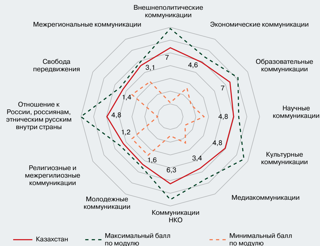
Рисунок 9 – Профиль коммуникационного режима Республики Казахстан (в баллах)

Коммуникационный режим Казахстана характеризуется противоречивыми нормами и правилами. С одной стороны, на высшем уровне декларируется стратегическое партнерство с Россией, развивается экономическое сотрудничество, используются преимущества ЕАЭС, СНГ, ОДКБ, ШОС. С другой стороны, страна тесно сотрудничает с недружественными России странами, все отчетливее формирует новую культурно-языковую среду на основе определенных правил и принципов, недружественных России (например, трактовка исторических событий, расчет доли необходимого медиаконтента на русском языке и др.). Эти правила и принципы могут привести к сужению российско-казахстанских гуманитарных контактов. В 2024 г. коммуникационный режим Казахстана может стать менее благоприятным для России с учетом высокой конкурентности внешнеполитической среды, сотрудничества Казахстана со странами и организациями, поддерживающими центробежные постсоветские процессы.