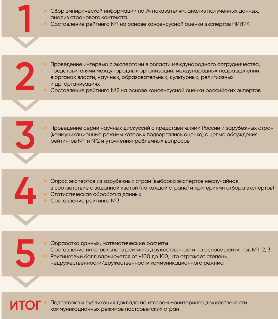
Рисунок 18 – Этапы проведения мониторинга

Мониторинг проводится поэтапно (рисунок 18).