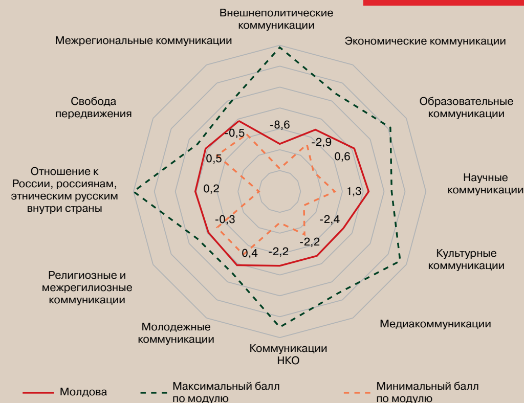
Рисунок 13 – Профиль коммуникационного режима Республики Молдова (в баллах)

Основным содержательным компонентом коммуникационного режима Молдовы в 2023 г. стал рост враждебности в отношении России. Принимались соответствующие решения и изменялось законодательство в узкокорпоративных интересах власти и внешних акторов, оказывающих влияние на политические институты Молдовы. По факту, коммуникации страны управляются извне. 2023 г. показал тенденции к потере собственной идентичности (расширению румынского влияния), размыванию государственности и несогласие большей части общества с позициями власти в отношении России. Высока вероятность, что усиление контроля за информационными каналами, цензурирование медиаконтента и размещение только антироссийских материалов в 2024 г. приведет к росту враждебности не только среди правящей элиты, но и среди населения.