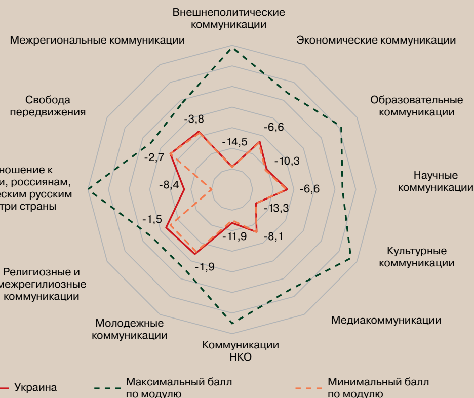
Рисунок 17 – Профиль коммуникационного режима Украины (в баллах)

Коммуникационный режим Украины характеризуется отсутствием условий и возможностей для коммуникаций практически по всем направлениям. Украина находится в военной конфронтации с Россией, выступая источником русофобии и ложной информации. Медиа контент, касающийся русских и России, наполнен ненавистью и угрозами. Не являясь самостоятельной в принятии решений и не имея собственных ресурсов для ведения военных действий, Украина ориентирована на Запад, а точнее – на страны НАТО.