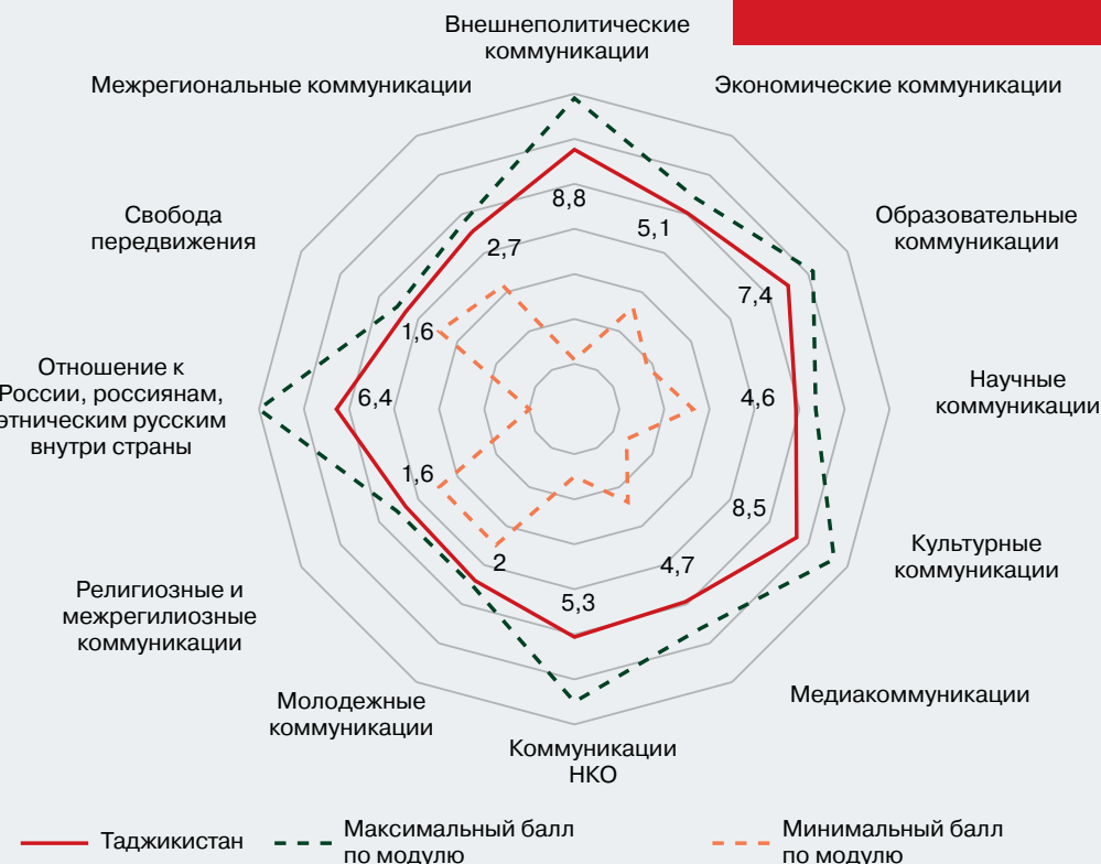
Рисунок 6 – Профиль коммуникационного режима Республики Таджикистан (в баллах)

За период 2023 г. улучшились условия и возможности для развития экономических коммуникаций, инвестирования в социальную сферу и молодежные коммуникации. Наиболее сложно реализуемым видом коммуникаций, как и ранее, остаются коммуникации по линии НКО. Информационное поле Таджикистана насыщено не только официальной информацией, но и информацией частного характера, что в совокупности и формирует образ России. Источниками информации о России являются не только СМИ, но и мигранты, в большом количестве находящиеся в России и сохраняющие связь с Родиной. Россия остается для граждан Таджикистана наиболее привлекательной страной для образования, трудоустройства и гражданства.