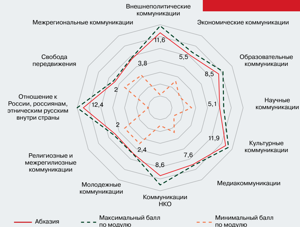
Рисунок 4 – Профиль коммуникационного режима Республики Абхазия (в баллах)

Нормы и правила международных коммуникаций, сложившихся в Абхазии, во многом схожи с российскими и способствуют формированию общего экономического, информационного, гуманитарного, политического пространств Абхазии и России. Будучи одной из стран Черноморского региона, Абхазия хотела бы более выгодно использовать этот потенциал и выстроить отношения не только с Турцией, но и с черноморскими странами ЕС. Периодически возвращаясь к этой идее, Абхазия наталкивается на неизменную позицию непризнания со стороны стран ЕС. Изменения коммуникационного режима в 2023 г. касались усиления контроля за НКО с иностранным финансированием, расширения спектра русскоязычных медиаресурсов (газета «Вестник Абхазии», портал Абхазия.рф), появления более критичного контента в отношении западных стран, увеличения возможностей для молодежных коммуникаций.