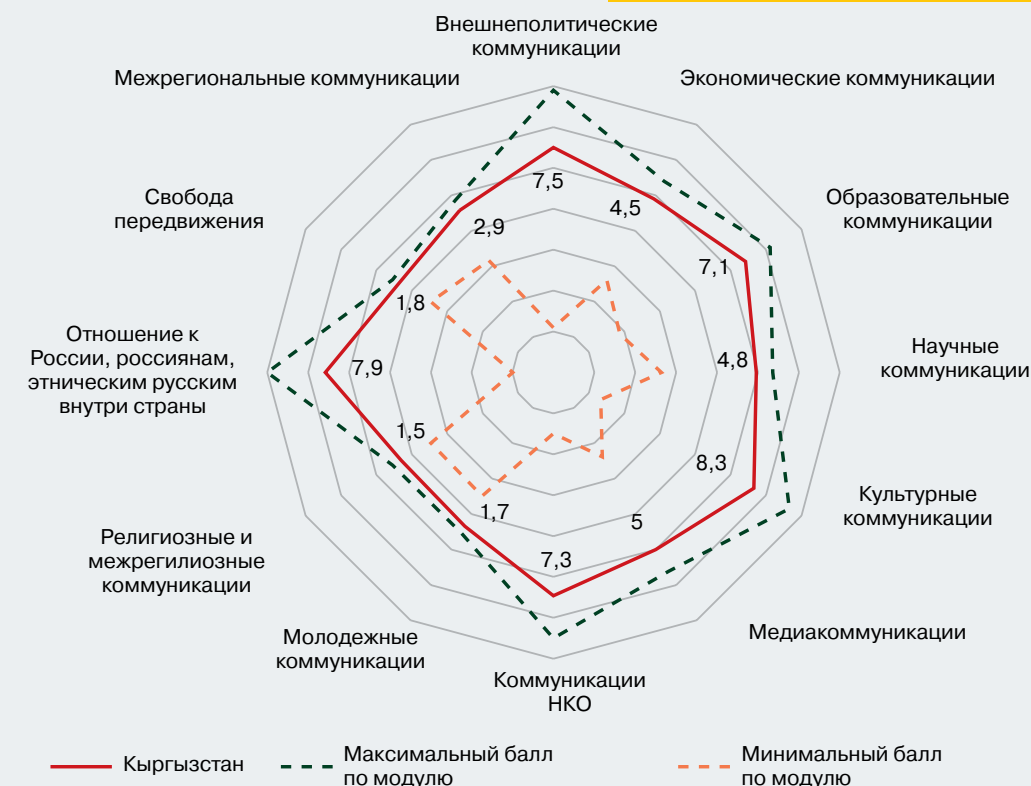
Рисунок 5 – Профиль коммуникационного режима Кыргызской Республики (в баллах)

Мониторинг 2023 г. показал неустойчивость коммуникационного режима Кыргызстана. Сохранились возможности для коммуникаций экономического, гуманитарного характера и политического диалога. Проявились несколько центров внутри политического истеблишмента, претендующих на право формировать нормы и правила коммуникации, преимущественно ориентированные: 1) на сотрудничество с Россией; 2) с западными странами; 3) радикально настроенными акторами, ищущими особую идентичность. Противоречия между группами наиболее очевидно проявились в отношении русского языка (решения о снижении его доли в деловой коммуникации), реформ систем образования и воспитания (европейский подход, или российский, или турецкий, а также язык обучения), внешнеполитических приоритетов (предпочтительные форматы интеграций – СНГ, ЕАЭС, ШОС, ОТГ, ОИС, внутрирегиональные форматы с участием внерегиональных акторов и др.). Усилился контроль за медиаконтентом (акцент на традиционные ценности). По результатам мониторинга 2022 г. Кыргызстан был отнесен к дружелюбным, флуктуирующим режимам. Эта характеристика остается и в 2023 г.