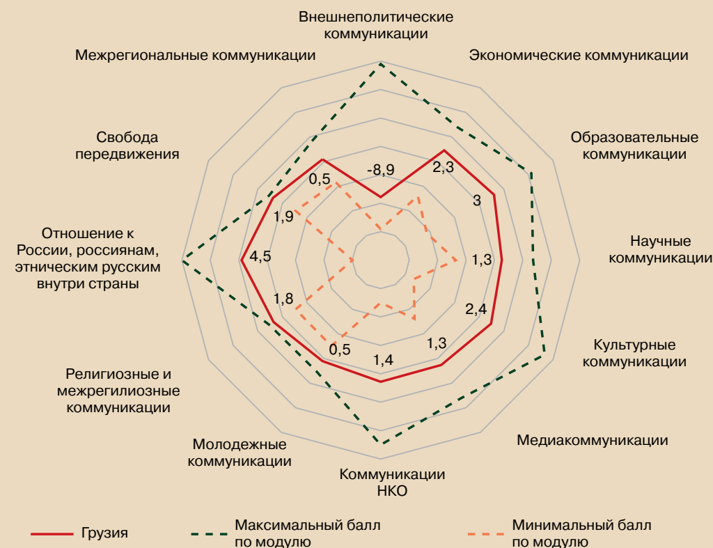
Рисунок 12 – Профиль коммуникационного режима Грузии (в баллах)

Грузия вошла в группу относительно дружественных/недружественных коммуникационных режимов. Режим внешнеполитической коммуникации остался антироссийским. Россия рассматривается как страна, от которой исходит угроза национальной безопасности и целостности Грузии. На всех международных площадках и в политических решениях Грузия придерживалась позиции противников России. Большая часть населения Грузии, долгое время находящаяся в недружественном России информационном поле, сформировала критичное и даже негативное отношение к России. При этом более 60% считает, что с Россией надо вести диалог. На уровне частных инициатив поддерживаются научные, образовательные, культурные, молодежные коммуникации. На официальном уровне поддерживается диалог между церквями (ГПЦ и РПЦ) и между субъектами бизнеса.