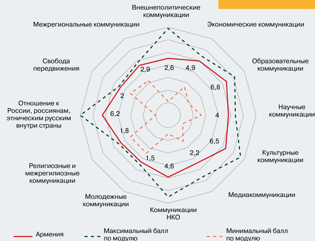
Рисунок 11 – Профиль коммуникационного режима Республики Армения (в баллах)