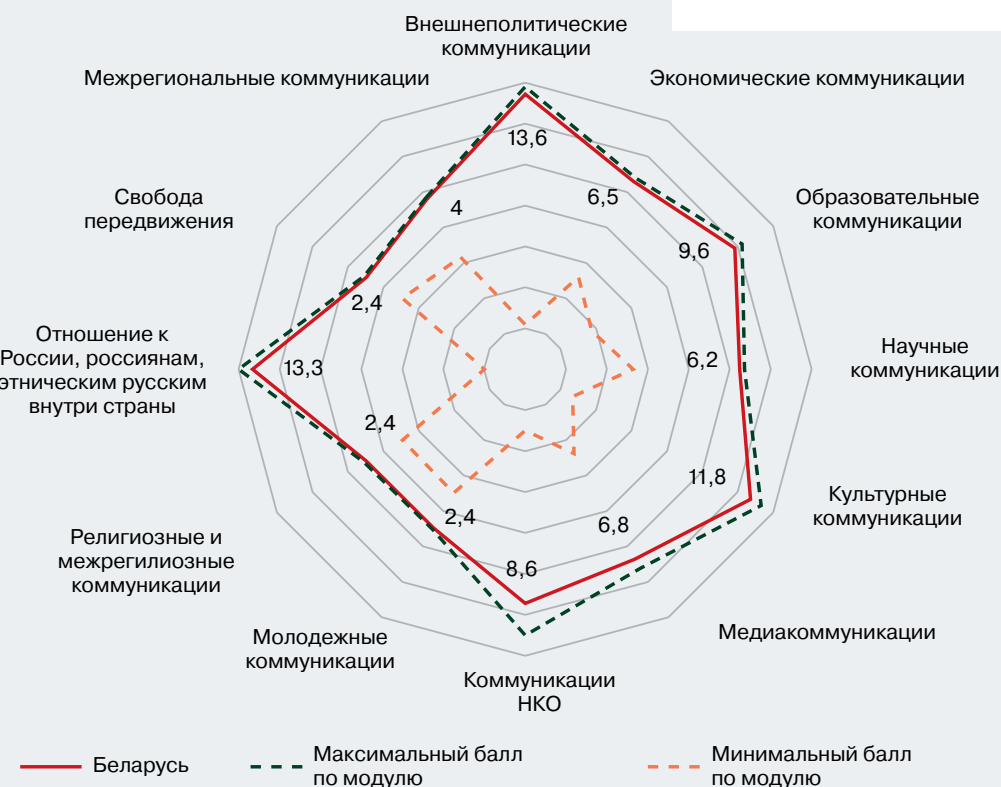
Рисунок 3 – Профиль коммуникационного режима Республики Беларусь (в баллах)

Коммуникационный режим Беларуси по состоянию на конец 2023 г. способствует развитию общего культурного, экономического и политического пространств. Важную роль в формировании общего экономического пространства играют сотрудничество стран в форматах Союзного государства, СНГ и ЕАЭС, активные межрегиональные коммуникации, личные позиции глав государств. Общее гуманитарное пространство основано на общем историко-культурном прошлом, схожих подходах в политике памяти, понимании ценностей общества, принципов образования и воспитания. Схожесть трактовки международных процессов, оценок международных акторов, общность позиции на международных площадках, позиции в отношении СВО – все это показывает дружелюбность коммуникационного режима Беларуси. В стране созданы благоприятные условия и возможности для развития многосторонних коммуникаций с Россией. Мониторинг 2023 г. выявил также общие политические риски России и Беларуси, в частности, санкционное давление, формирование зарубежных центров давления на коммуникационные режимы России и Беларуси, зарубежная подготовка акторов потенциальной общественно-политической дестабилизации (в т. ч. дислоцирующихся на территории Литвы).