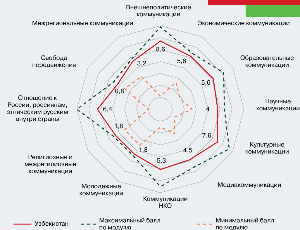
Рисунок 7 – Профиль коммуникационного режима Республики Узбекистан (в баллах)

В 2023 г. коммуникационный режим Узбекистана продемонстрировал свою устойчивость и благоприятные условия развития экономических, культурных, молодежных коммуникаций не только для России, но и других стран, в том числе недружественных России. Политические коммуникации также были весьма многовекторны, но при сохранении приоритетов экономического партнерства с Россией. Наиболее уязвимой сферой коммуникационного режима Узбекистана является гражданский сектор, испытывающий давление западных НКО. Высока вероятность того, что в 2024 г. произойдут изменения условий работы НКО и трансформация медиасреды. В перспективе это может стать фактором трансформации коммуникационного режима в целом.