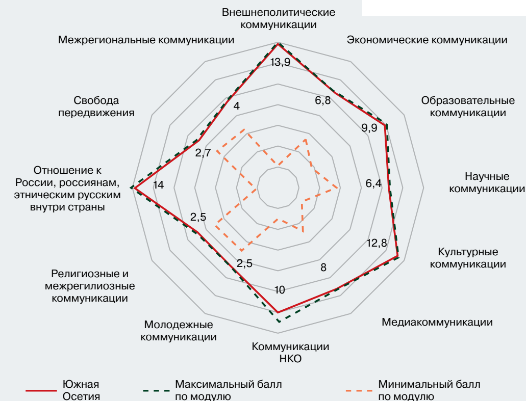
Рисунок 2 – Профиль коммуникационного режима Республики Южная Осетия (в баллах)

Коммуникационный режим Южной Осетии является наиболее дружелюбным из всех постсоветских стран. Нормы, правила коммуникаций во многом синхронизированы с российскими подходами и развиваются в направлении формирования единого информационного, социально-экономического, культурно-исторического пространства, на основе взаимной внешнеполитической поддержки и союзнических отношений. Южная Осетия приняла решение направить добровольцев в зону боевых действий СВО и оказывает России всестороннюю поддержку. Накопленный опыт становления своей государственности, правовая и материальная база, созданная в сотрудничестве с Россией, дает возможность ставить новые задачи – развитие внутренних ресурсов, выгодное использование геоэкономического потенциала, активизация человеческого капитала Южной Осетии для повышения эффективности использования внутреннего потенциала страны.