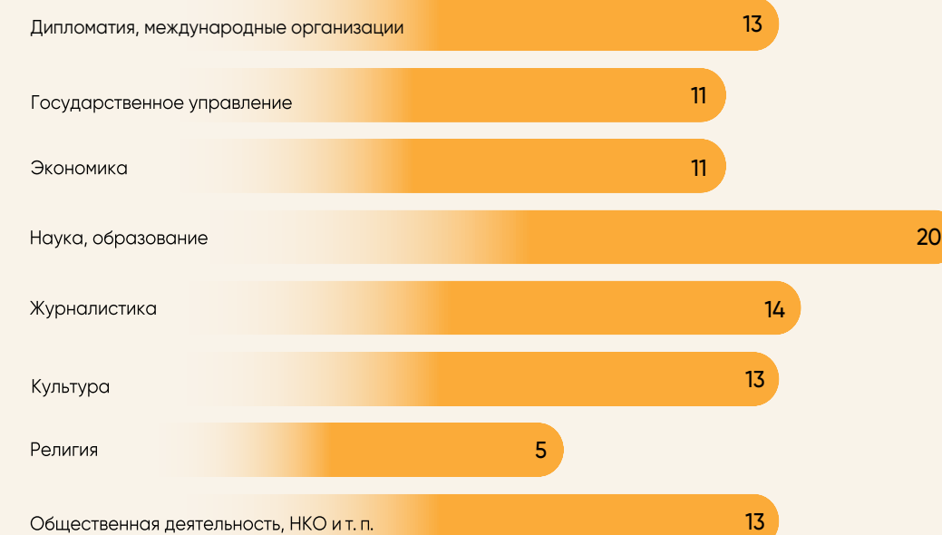
Рисунок 19 – Сферы деятельности экспертов (в %)