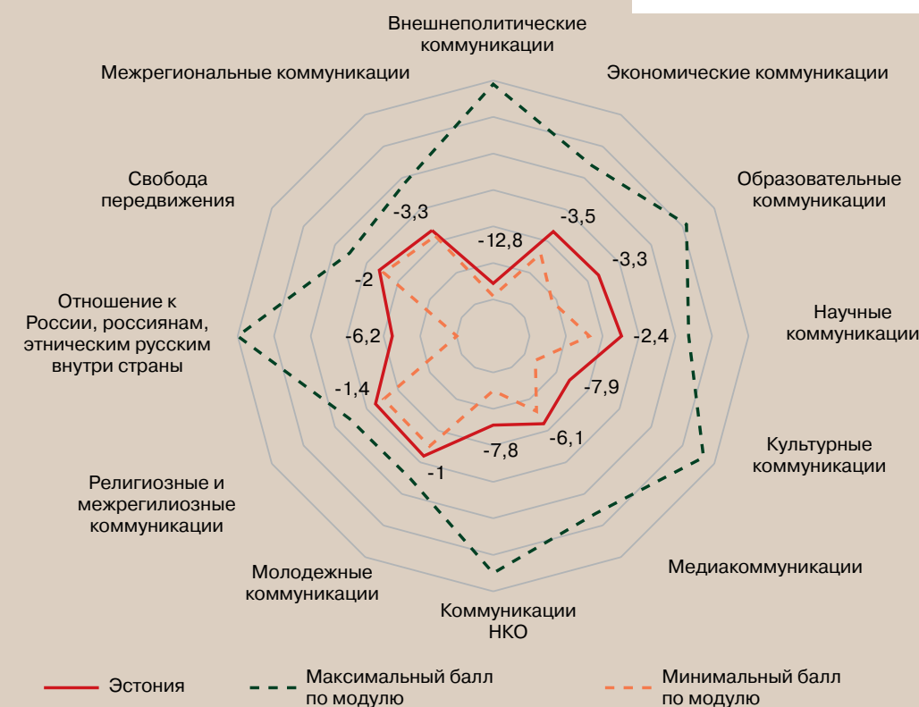
Рисунок 14 – Профиль коммуникационного режима Эстонской Республики (в баллах)

Коммуникационный режим Эстонии схож с режимами Латвии и Литвы. Основная тенденция всех изменений – рост русофобии и враждебности. Эстония в 2023 г. продолжила создавать новые ограничения, блокируя возможности не только межгосударственных, межрегиональных взаимодействий, но и частных коммуникаций граждан Эстонии и России.