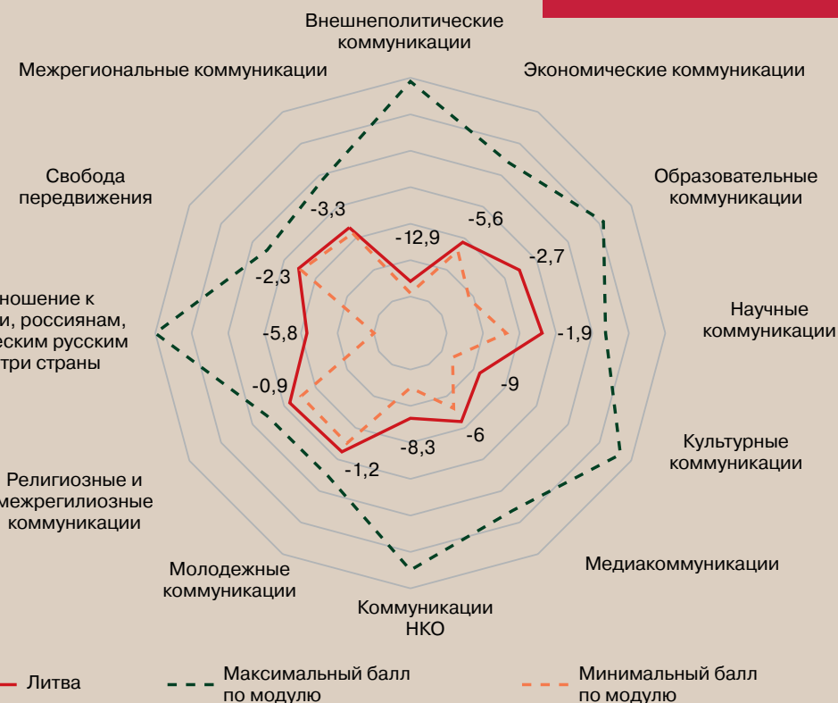
Рисунок 15 – Профиль коммуникационного режима Литовской Республики (в баллах)

Литва, как и в 2022 г., вошла в группу стран с недружественными коммуникационными режимами. В течение года произошло новое сокращение возможностей коммуникаций с этой страной и рост агрессии в отношении России. 2023 г. дает основания полагать, что Литва становится хабом подготовки оппозиции (в т. ч. из граждан России и Беларуси), нацеленной на дестабилизацию общественно-политической ситуации в России и в Беларуси.